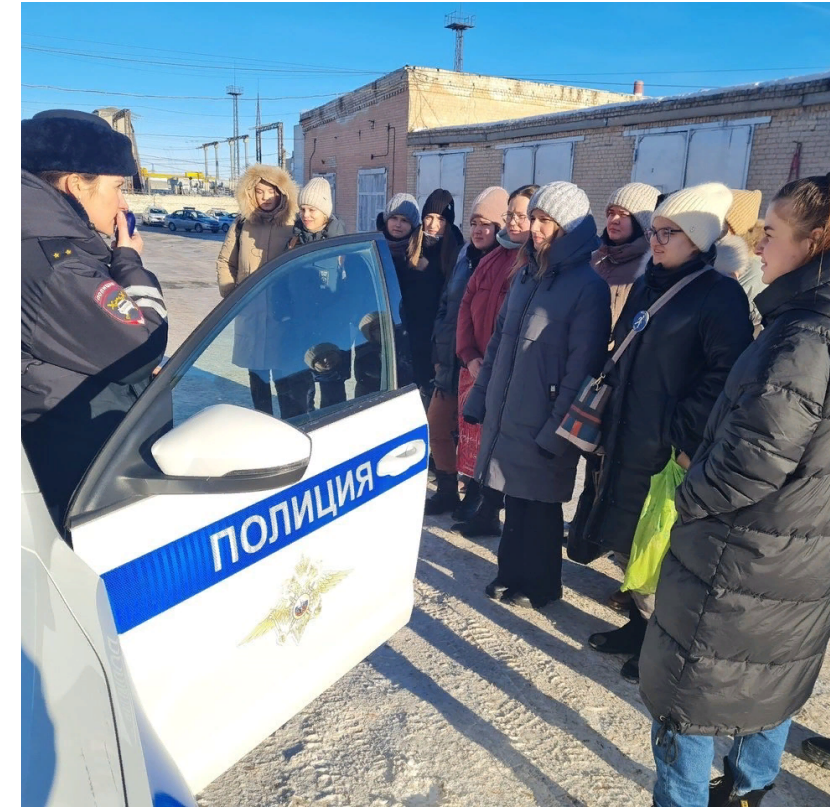
Экскурсия в местный отдел ГИБДД