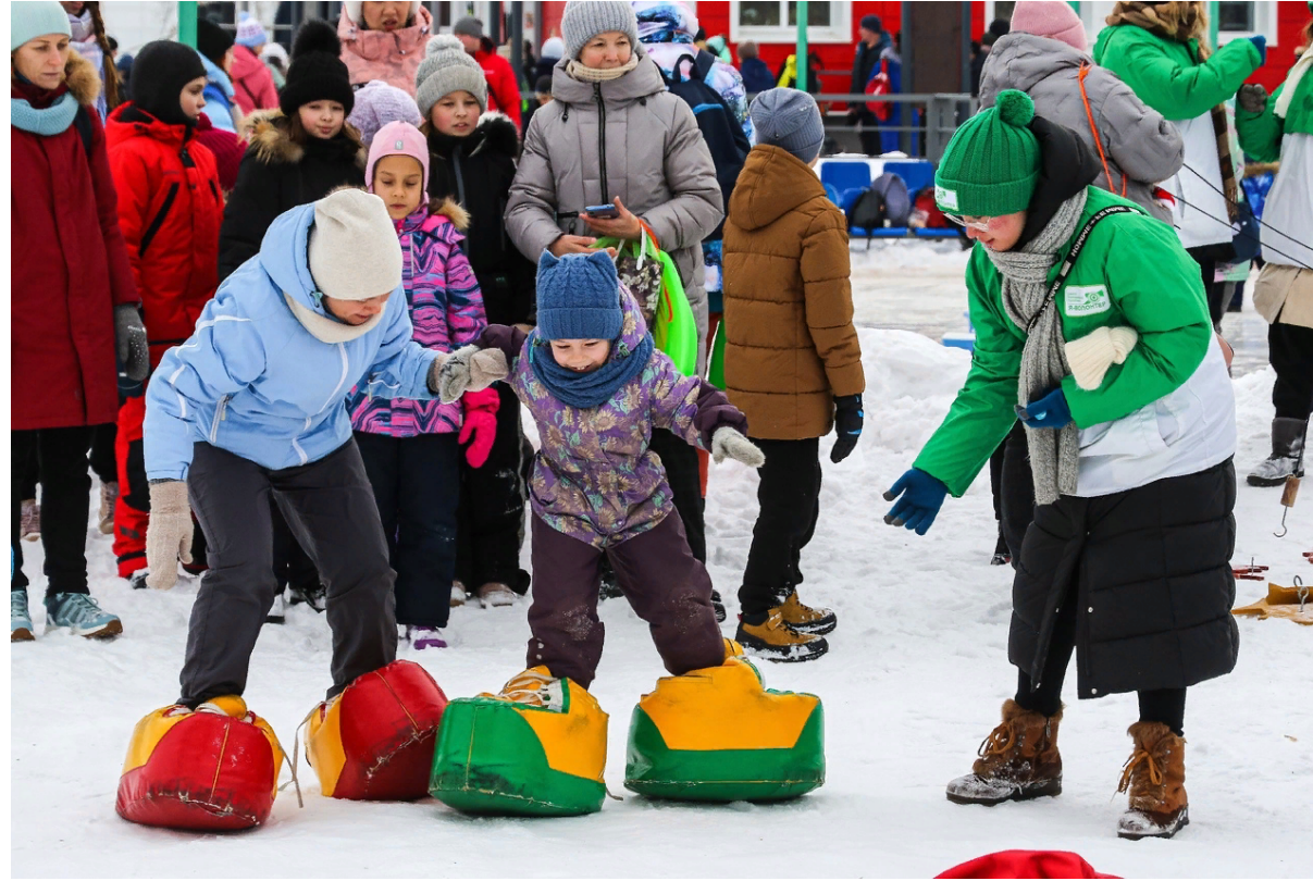
Волонтерство на мероприятии "День снега"